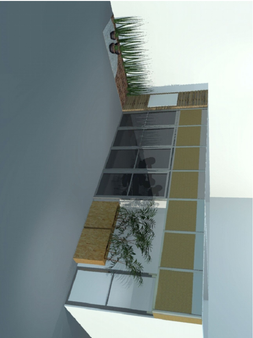
3D - SALA DE NEGÓCIOS

OBSERVAÇÃO: Todas as medidas deverão ser confirmadas e conteúdos in loco pelo executor