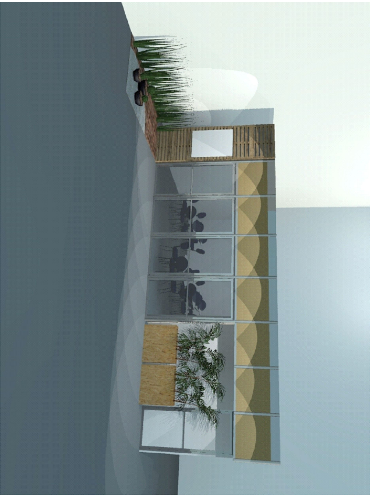
3D - SALA DE NEGÓCIOS